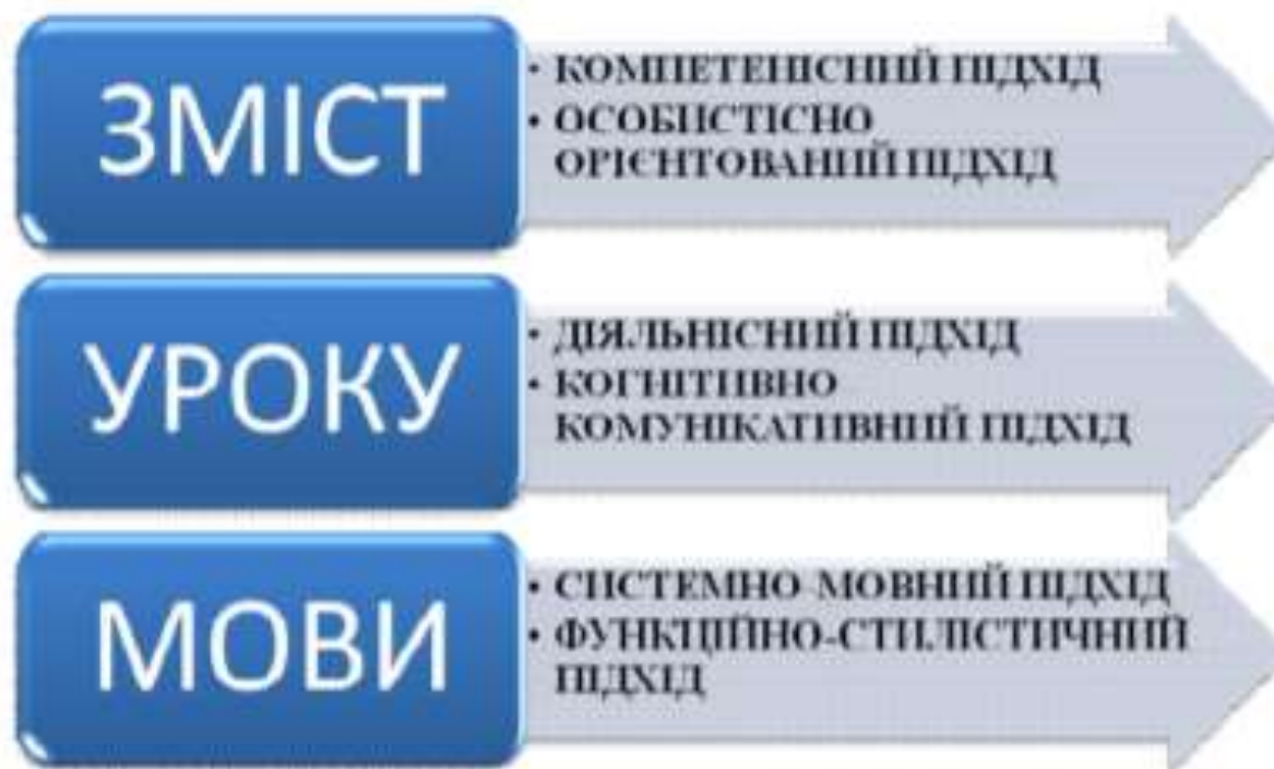
Схема 1. Концептуальні підходи до проектування змісту уроку рідної мови