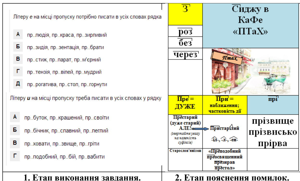
Рис. 3. Зразок онлайн-тестів та ілюстрації правила

Далі активізацію навчальної діяльності на завершальному етапі вивчення української мови, на нашу думку, слід починати з практичних завдань (див. рис. 3). За умови низького рівня знань помилки необхідно пояснити (використовуючи правило на практиці), щоб учні усвідомили механізм виконання завдання.