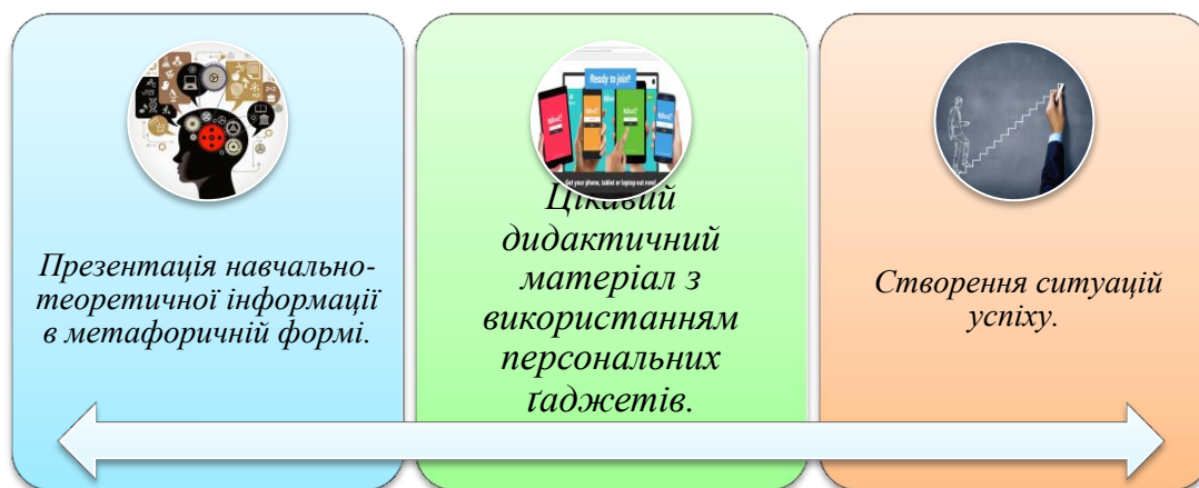
Рис. 1. Напрями позитивної мотивації в навчанні мови

Тому для формування позитивної мотивації в навчанні мови (див. рис. 1) ( пізнавального інтересу засобами предмета, стимулювання особистісного успіху в навчанні, розвитку потреб самостійної навчально-пізнавальної діяльності та спонукання до мовотворчого самовираження ) слід дотримуватися чітких умов [3; 253].